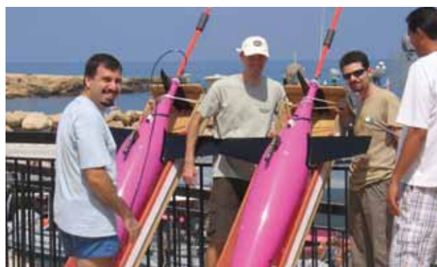
Υποβρύχια στην Παραλίμνι για δοκιμασίες το Σεπτέμβριο 2008.

υποβρυχίων οχημάτων θα βοηθήσουν στη βελτίωση των αριθμητικών μοντέλων του Ωκεανογραφικού Κέντρου που προβλέπουν επιχειρησιακά την κυκλοφορία, τη θερμοκρασία και την αλμυρότητα της θάλασσας γύρω από την Κύπρο. Αυτές οι προβλέψεις είναι ιδιαίτερα χρήσιμες σε επιχειρήσεις έρευνας και διάσωσης και στην πρόβλεψη της διασποράς πετρελαιοκηλίδων. Περισσότερες πληροφορίες δίνονται στην ιστοσελίδα του Ωκεανογραφικού Κέντρου: http://www.oceanography.ucy.ac.cy