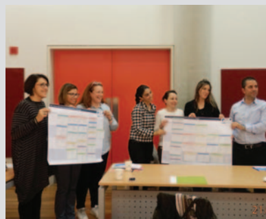
Από το εργαστήριο "Research-based education assessments directed at an audience" που πραγματοποιήθηκε στις 20 & 21 Νοεμβρίου 2017. Το εργαστήριο παρουσίασε ο Δρ. Nicholas Grindley, Centre for the Advancement of Learning and Teaching, UCL, UK. Διάρκεια: 6 ώρες. Αριθμός συμμετεχόντων: 19. Το συγκεκριμένο εργαστήριο προσφέρεται στο UCL ως μέρος του προγράμματος για τη διδασκαλία που παρακολουθούν υποχρεωτικά οι νέοι διδάσκοντες.

2 Διοργανώνει σειρά επιμορφωτικών σεμιναρίων (γενικών και εξειδικευμένων) για τους διδάσκοντες.