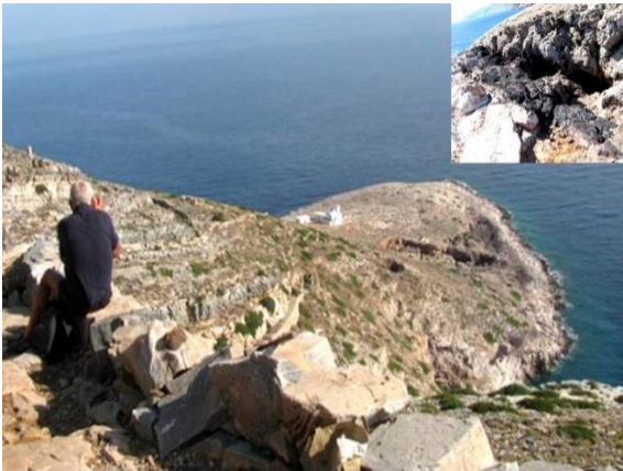
Η χερσόνησος του Αϊ Σώστη στη Σίφνο, όπου αποδείχθηκε ότι λειτουργούσε το «αρχαιότερο αργυρωρυχείο στον κόσμο».