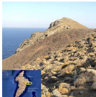
Απόθεση προϊστορικών μεταλλουργικών εκκαμινευμάτων, στη θέση «Σκουριές», Αν. Κύθνος.