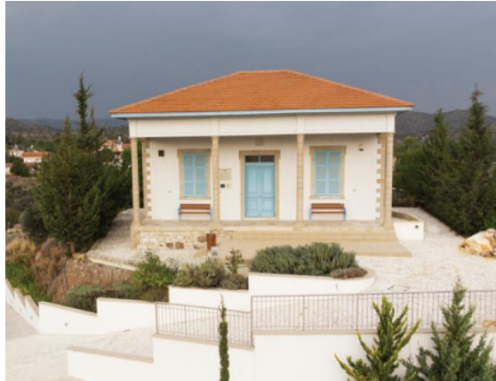
Το Παλαιό Δημοτικό Σχολείο Ασγάτας, το οποίο θα διαμορφωθεί σε «Κέντρο Ανάδειξης της Φυσικής και Γεω-Μεταλλουργικής Κληρονομιάς».